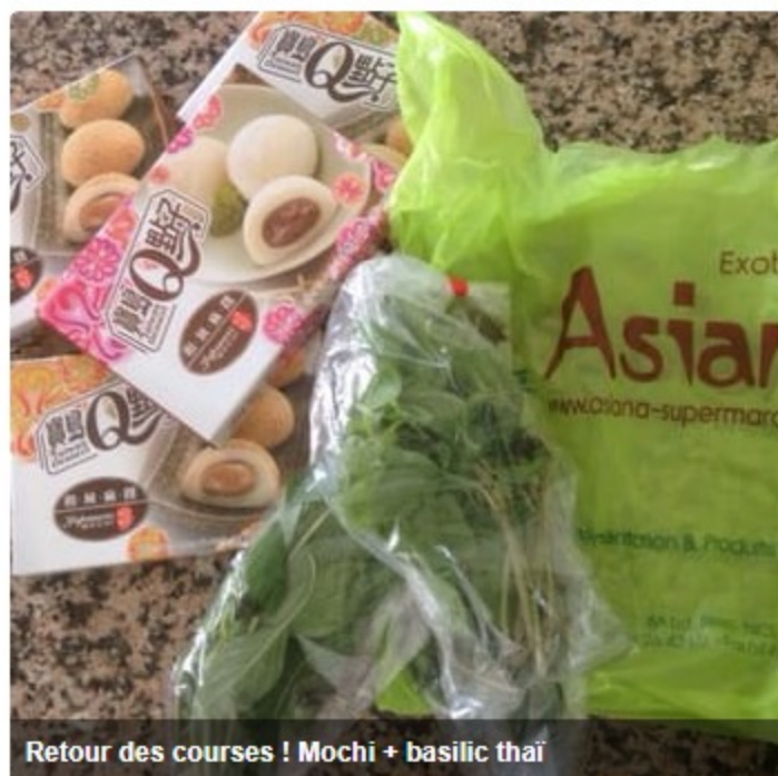
Retour des courses ! Mochi + basilic thaï

Pour une soirée 100 % asiatique, il y a aussi un large choix de vaisselle.